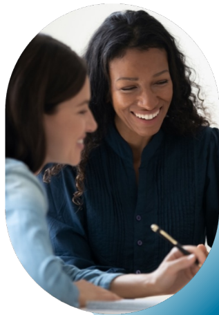
Opportunités de mentorat / Mentorship opportunities