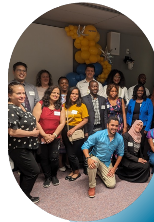
Visites du lieu de travail / Workplace tours