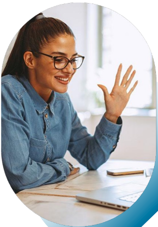
Simulation d'entretien / Mock Interviews