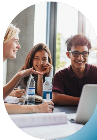
Expérience d'apprentissage en milieu professionnel simulé / Simulated workplace learning experience