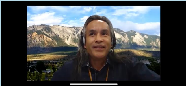
Cercles de dialogue, été 2021