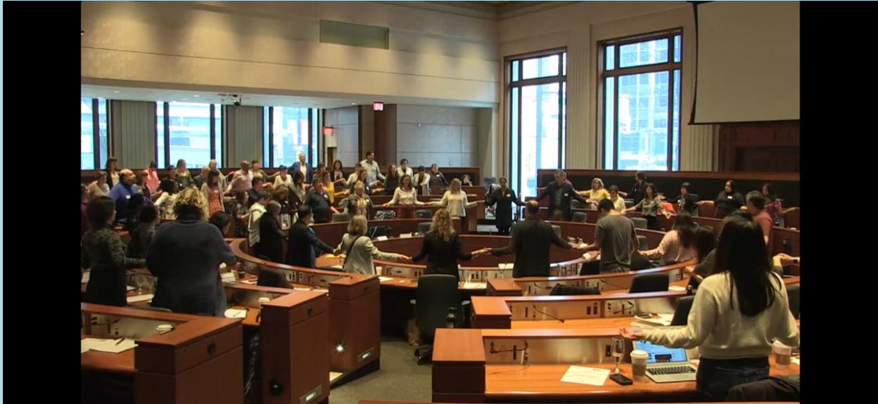
Symposium sur l'écoute, avril 2019