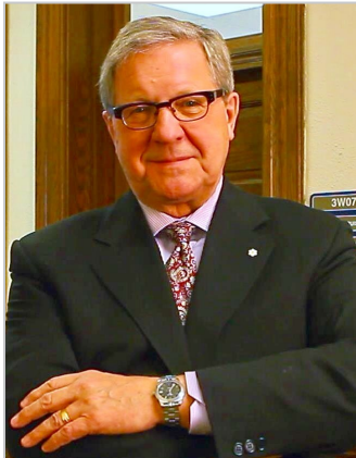
L'Honorable Lloyd Axworthy

nant les expériences d'immigrantes, et présentée la première fois au Festival Fringe d'Hamilton en juillet 2017.