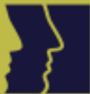
table de concertation des organismes au service des personnes réfugiées et immigrantes

Réseau des organismes de régionalisation de l'immigration du Québec (RORIQ)