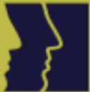
table de concertation des organismes au service des personnes réfugiées et immigrantes

Réseau des organismes d régionalisation de l'immigration du Québec (RORIQ)