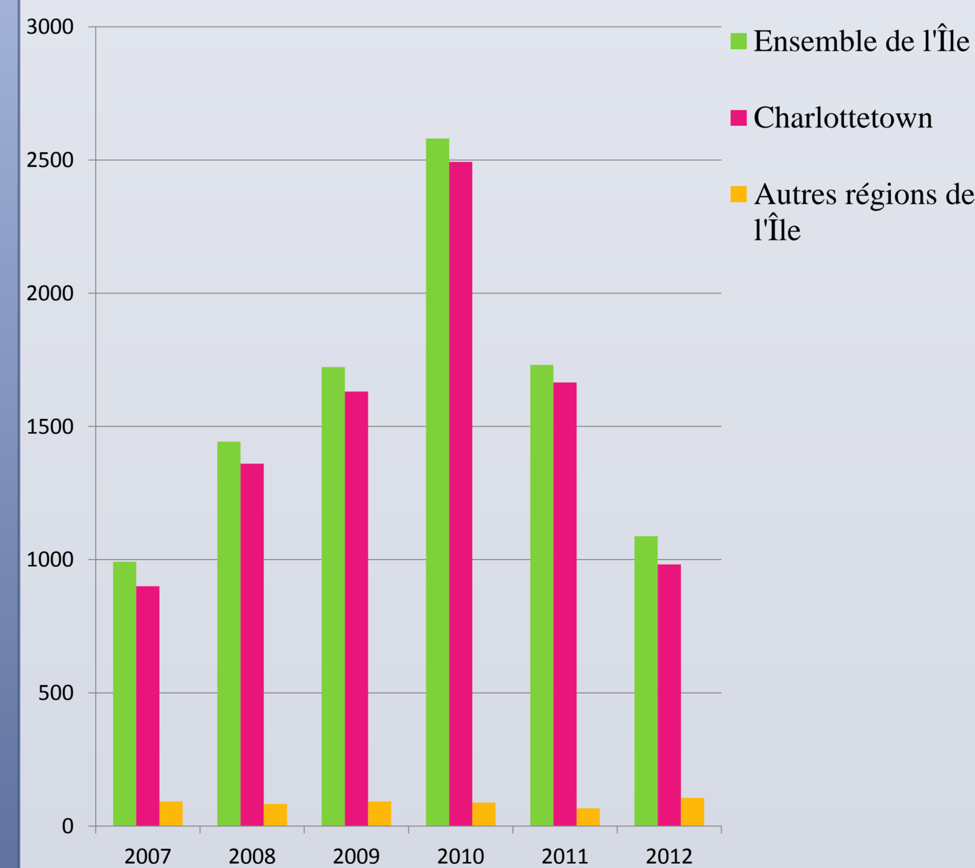
Résidents permanents, selon les connaissances linguistiques (ÎPÉ et TNL) 2007-2012